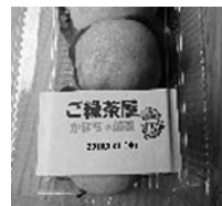
かぼちゃ饅頭 3個入り 200円