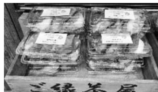
しば餅 3個入り 200円