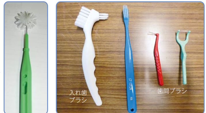
クルリーナブラシ