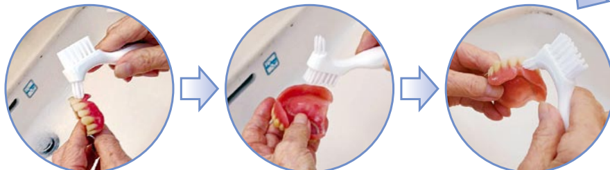
細かい溝は小さなブラシで

普通の歯磨き剤を使用すると、研磨剤によって入れ歯が傷ついて細菌が発生しやすくなり、粘膜の炎症や口臭の原因となる事があるので使用しない事が望ましいです。 (入れ歯用歯磨き剤もあります。)