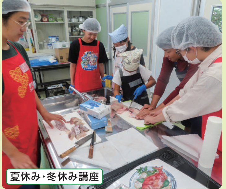
夏休み・冬休み講座