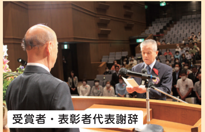
受賞者・表彰者代表謝辞